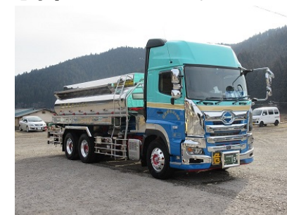
危険物タンクローリー