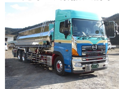
ハステロイローリー