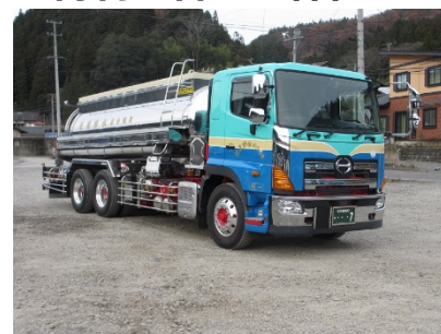
テフロンライニングローリー